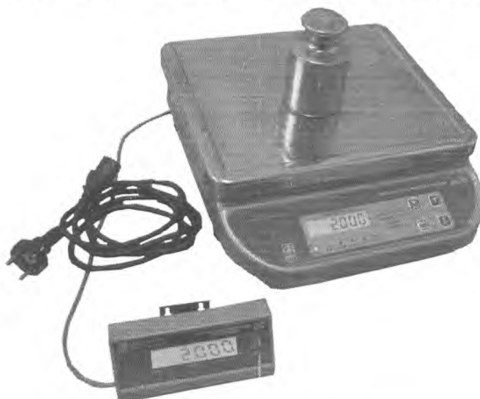
Рисунок 1 - Общий вид весов ВНЭм

Общий вид весов настольных электронных ВНЭм приведен на рисунке 1.