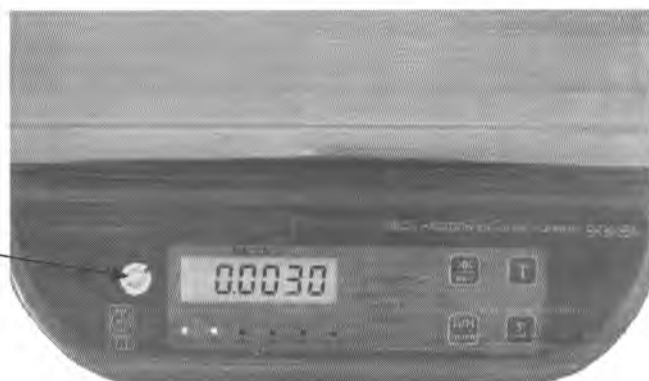
Панель управления и индикации