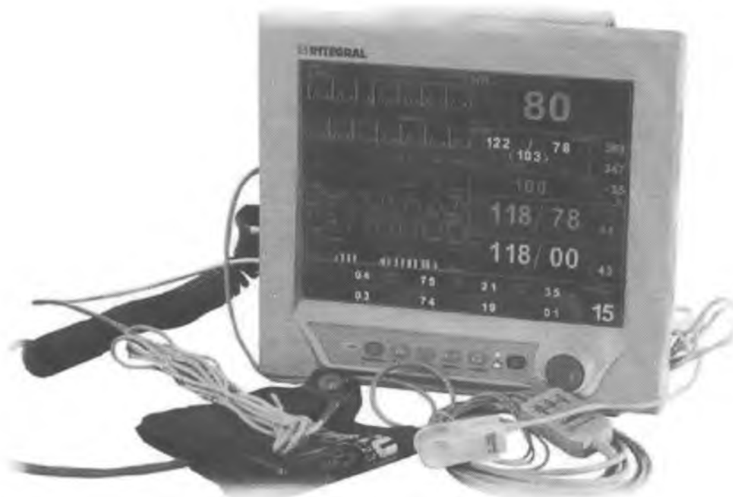
Рисунок 1 – Внешний вид монитора

Схема с указанием места нанесения знака поверки приведена в Приложении к описанию типа. Внешний вид монитора представлен на рисунке 1.