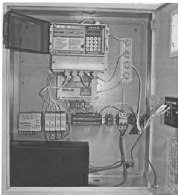
Рисунок 1 - СИ ИСТОК-ГАЗ-03, пример внутренней компоновки монтажного шкафа

ложении на примере комплекта поставки СИ ИСТОК-ГАЗ-03.