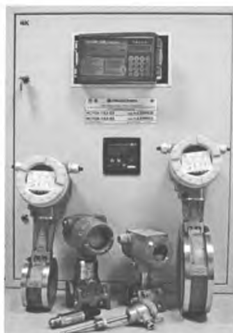
Рисунок 2 - СИ ИСТОК-ГАЗ-03, пример комплекта поставки (2-е СИ ИСТОК-ГАЗ-03 на разные Ду)