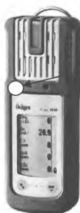
X-am 1700, X-am 2000, X-am 5000, X-am 5600

Место нанесения знака поверки (клейма-наклейки)