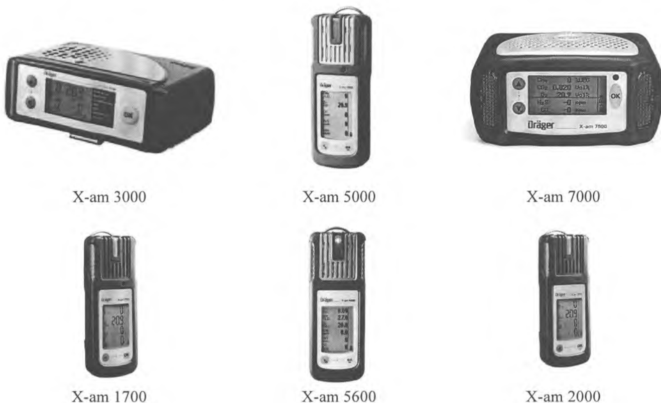
Рисунок 1 Внешний вид газоанализаторов X-am

Внешний вид газоанализатора приведен на рис. 1