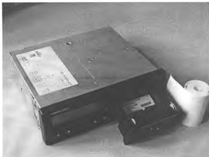
РИСУНОК 1- ВНЕШНИЙ ВИД ТАХОГРАФА ЦИФРОВОГО DTCSO 1381

При положительных результатах поверки выдается свидетельство о поверке и наносится знак поверки в виде клейма-наклейки на переднюю панель крышки корпуса тахографа, а также устанавливается пломбировочная проволока и свинцовая пломба с оттиском знака поверки при подключении датчика тахографа к коробке передач (см. приложение А).