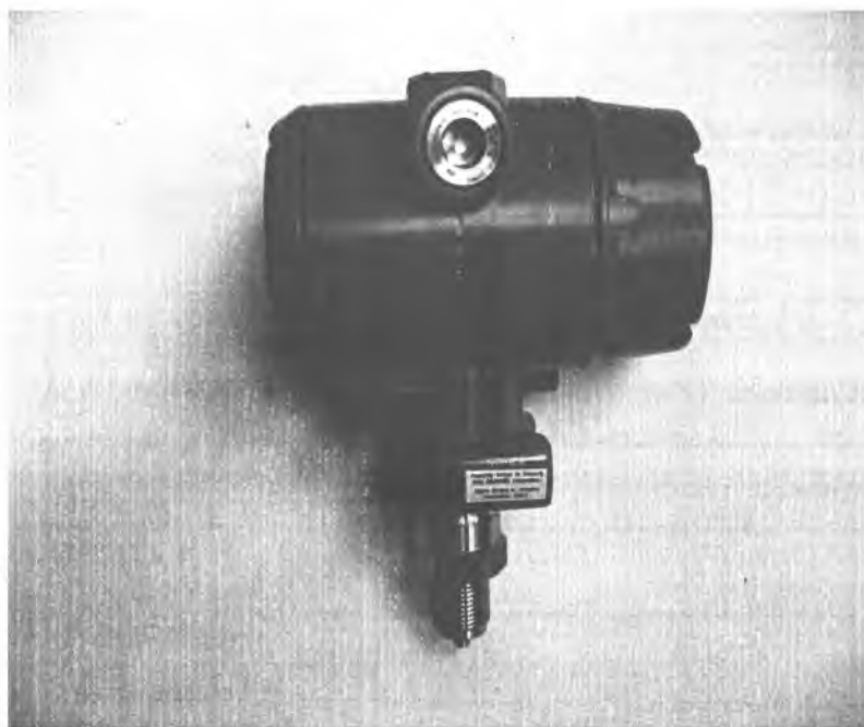
Рис. 1. Общий вид датчика давления Метран-75

Микропроцессор датчика корректирует цифровой код в зависимости от индивидуальных особенностей тензомодуля, а также в зависимости от температуры окружающей или измеряемой среды. Откорректированный цифровой код передается на цифровое индикаторное устройство (для визуализации результатов), а также на устройство, формирующее стандартный аналоговый и цифровой выходной сигнал.