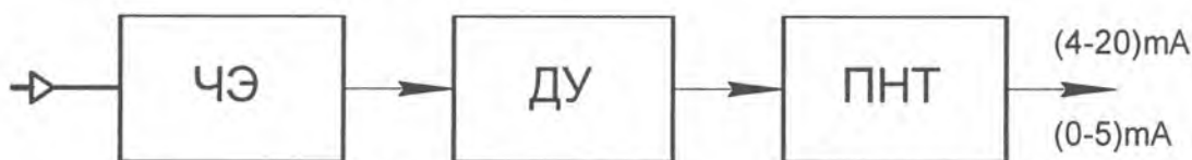
Рис.1. Структурная схема датчика давления ДДМ

Контролируемое давление воспринимается ЧЭ и преобразуется в пропорциональный электрический сигнал.