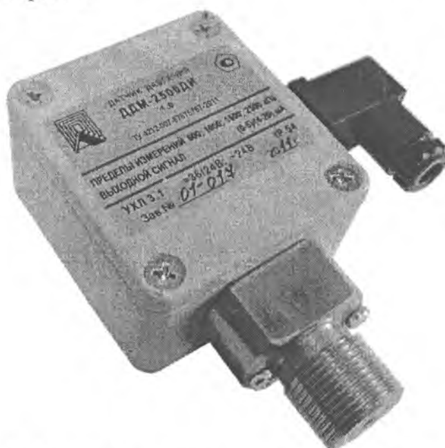
Фото 1. Фотография общего вида датчика давления ДДМ.

Датчики давления ДДМ являются многопредельными. Фотография общего вида датчика давления ДДМ приведена на фото 1.