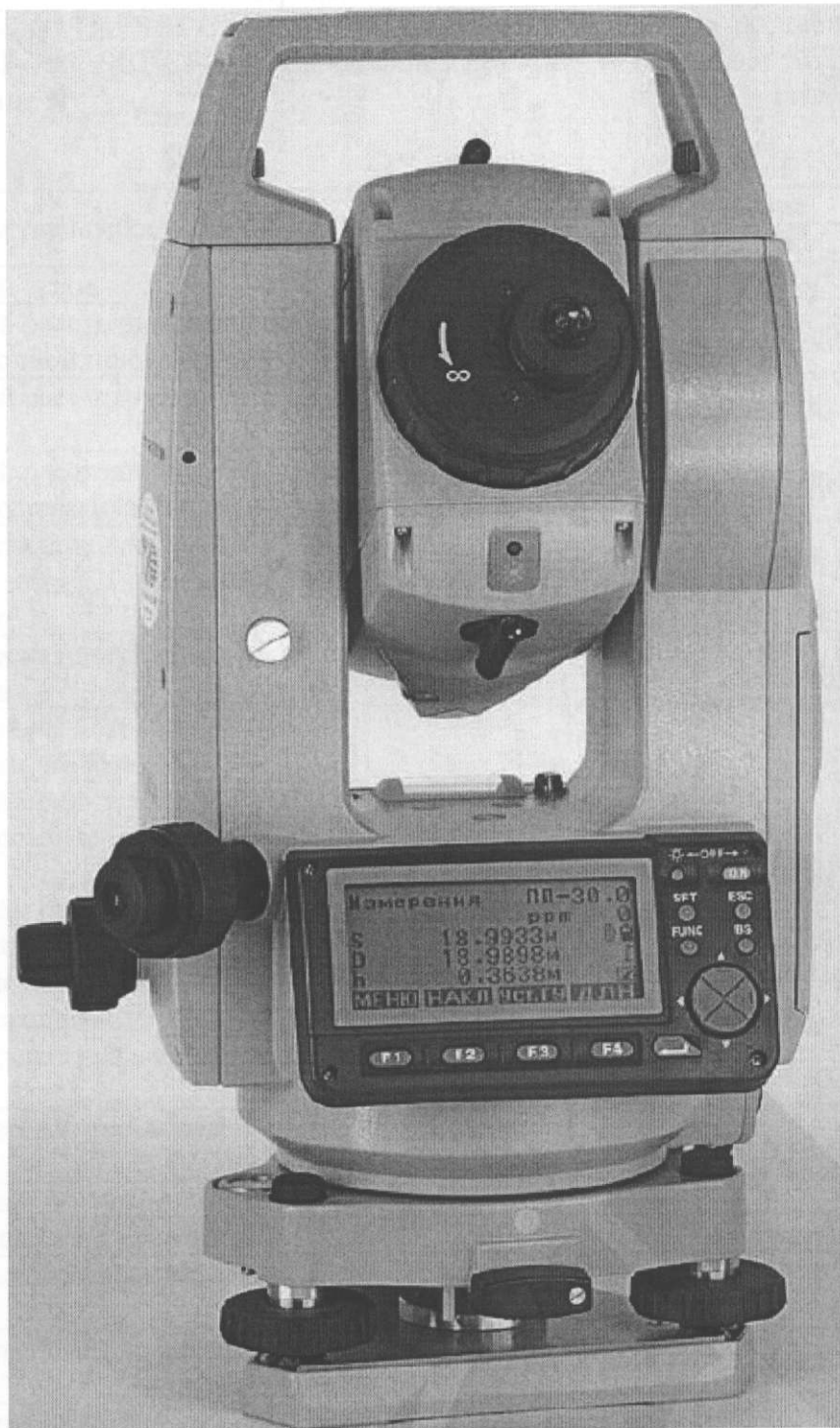
Рисунок 1 Внешний вид тахеометра