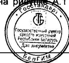
Схема указания мест расположения клейм-наклеек отдела технического контроля (далее – ОТК) и знака поверки средств измерений (далее – Знак поверки) на устройствах для защиты от несанкционированного доступа приведена на рисунке А.1 (приложение А).

Фотографии общего вида устройств приведены на рисунках 1 и 2.