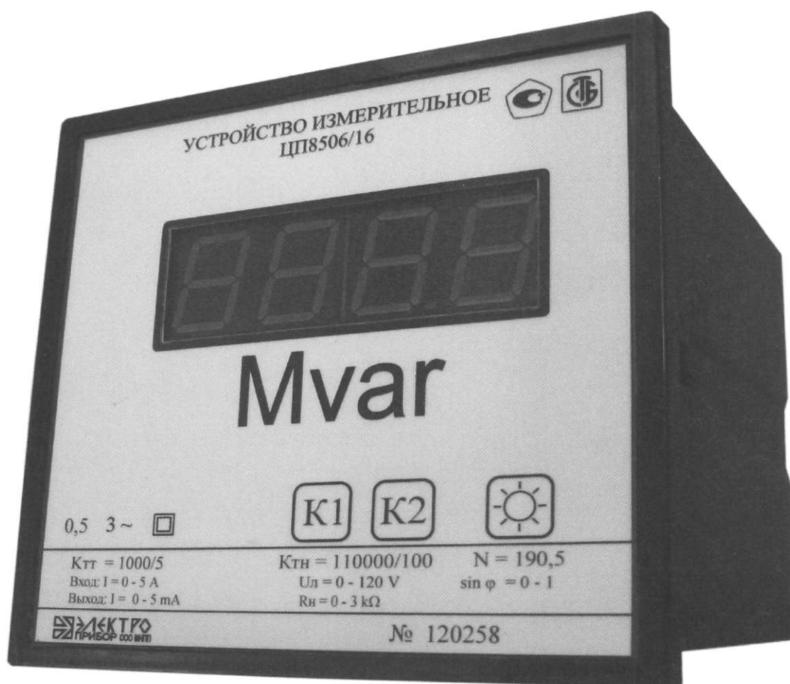
Рисунок 1 – Фотография общего вида ЦП8506/1 – ЦП8506/32