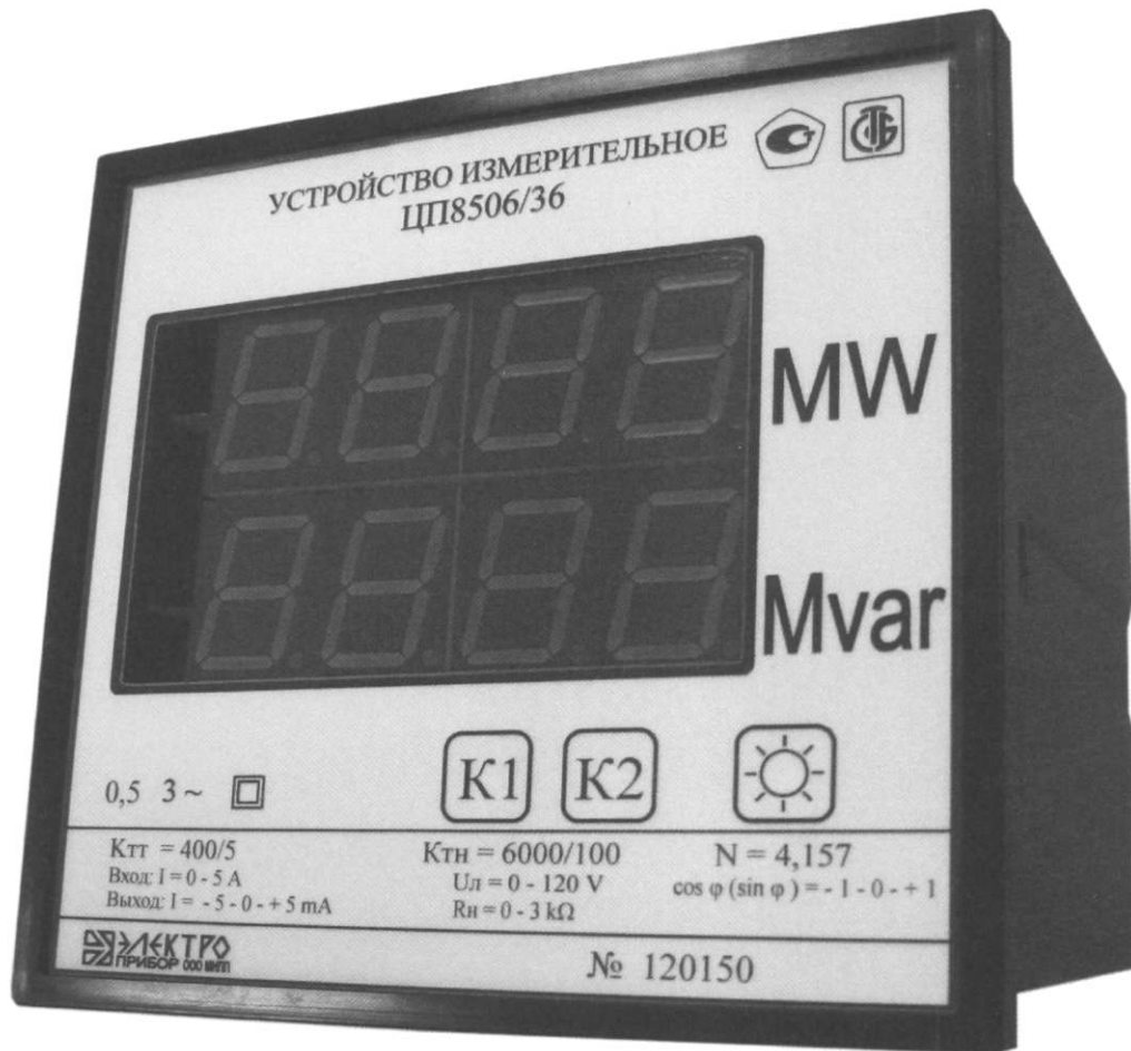
Рисунок 2 – Фотография общего вида ЦП8506/33 – ЦП8506/40