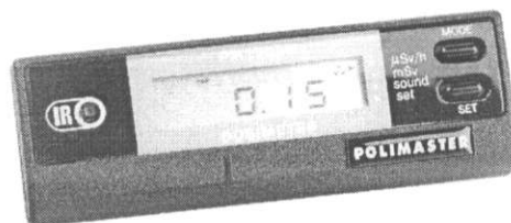
Рисунок 1 – Общий вид дозиметра

Дозиметры микропроцессорные ДКГ-PM1203 выпускают в двух модификациях, отличающихся диапазонами измерений МЭД, диапазонами рабочих температур и функциональными возможностями. Общий вид дозиметров представлен на рисунке 1.