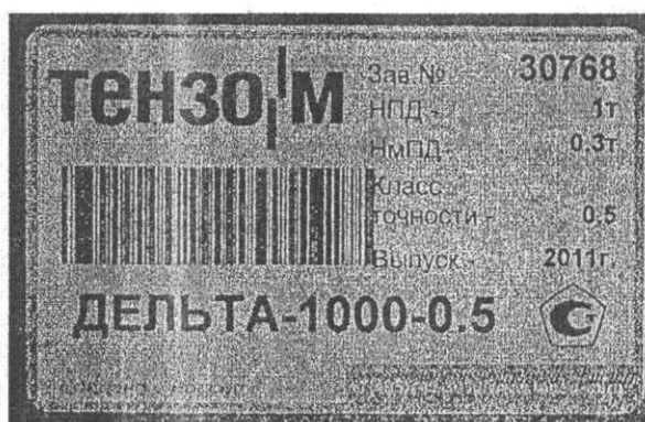
Рисунок 2 – Место нанесения знака поверки.

Место нанесения знака поверки показано на рисунке 2.