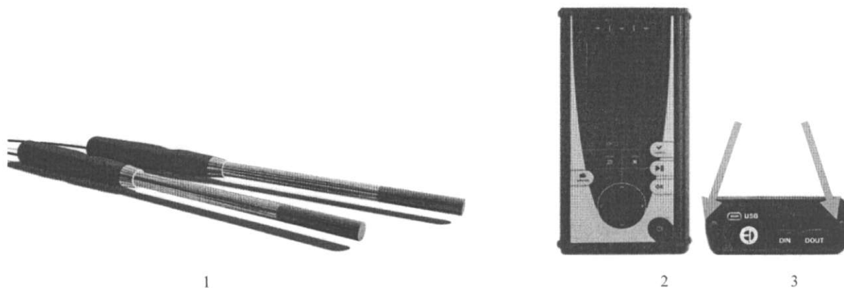
Рисунок 1 – Общий вид измерителя: 1 – измерительные зонды, 2 – индикаторный блок (лицевая панель); 3 – индикаторный блок (вид снизу); стрелками обозначены места пломбирования корпуса индикаторного блока измерителя