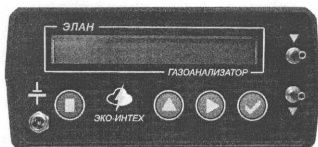
Внешний вид (передняя панель) газоанализатора ЭЛАН

Газоанализатор представляет собой автоматический показывающий и сигнализирующий прибор, конструктивно выполненный в блоке из ударопрочной пластмассы.