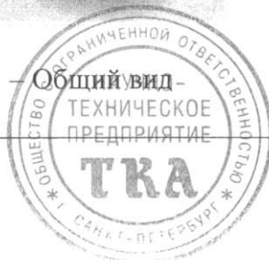
Рисунок 1 – Общий вид

КОПИЯ ВЕРНА Генеральный директор Томский суд