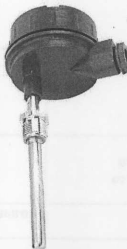
ТХАУ Метран-271 ТСМУ Метран-274 ТСПУ Метран-276