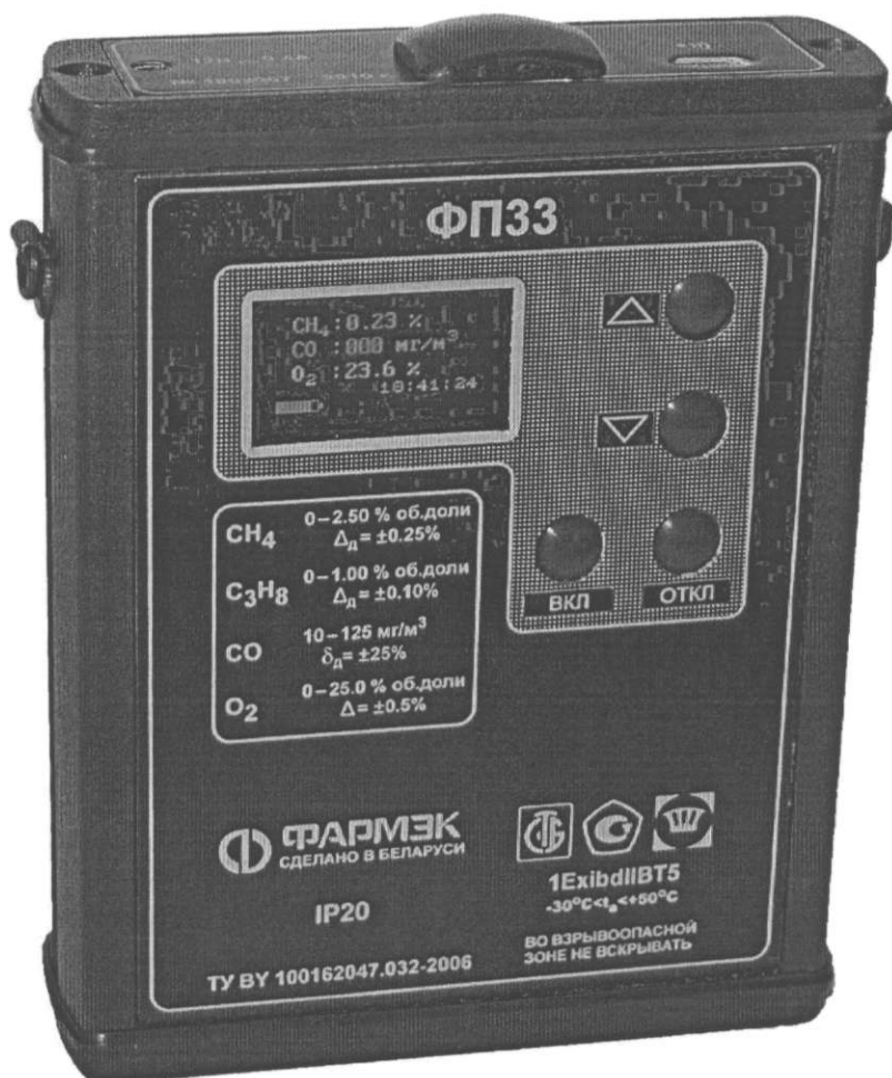
Рисунок 1 Внешний вид газоанализатора ФП 33

Схема пломбировки для защиты от несанкционированного доступа с указанием места для нанесения знака поверки и места пломбировки изготовителем приведена в приложении А к Описанию типа.