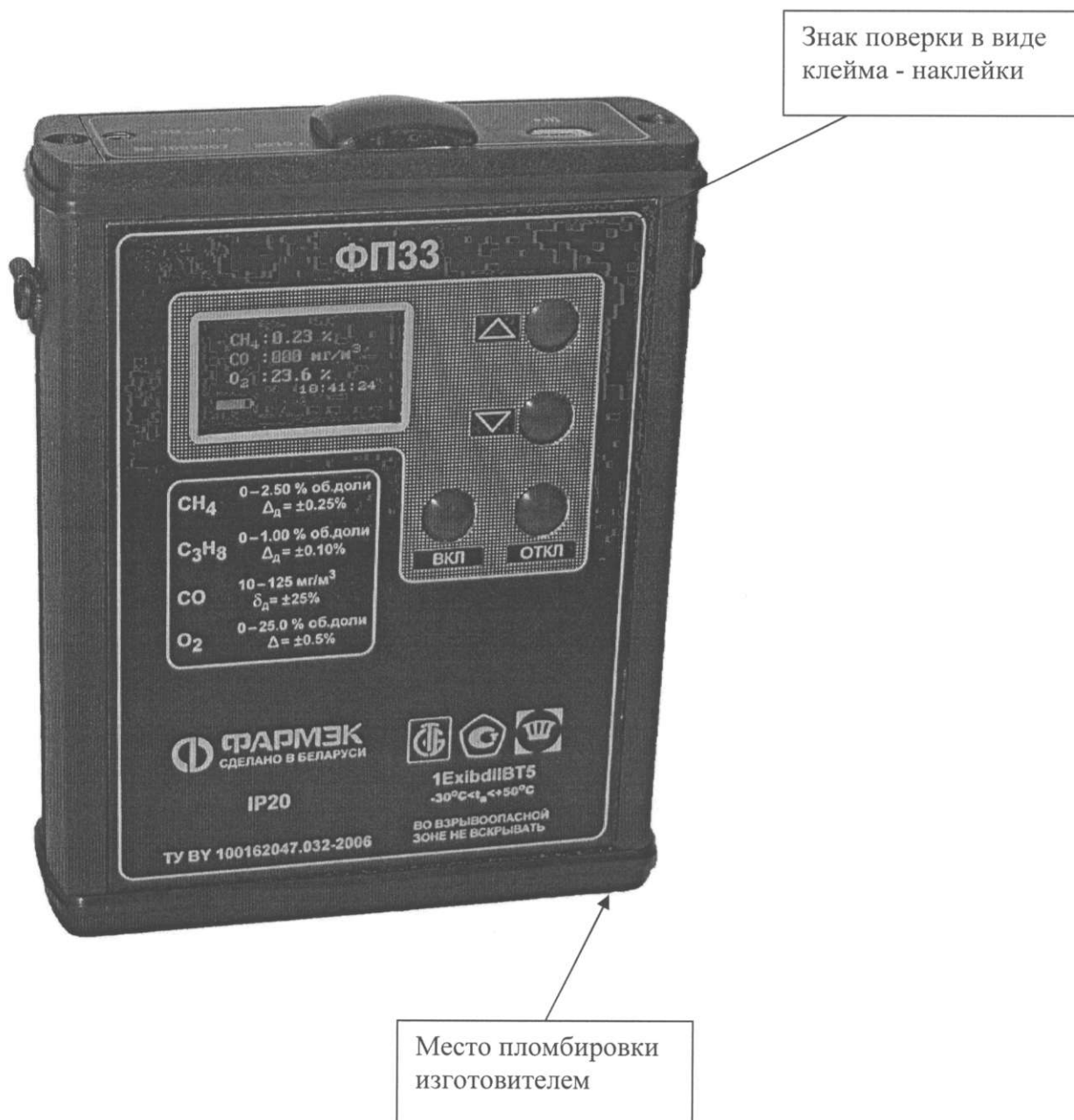
Схема пломбировки газоанализатора ФП 33 для защиты от несанкционированного доступа с указанием места для нанесения знака поверки