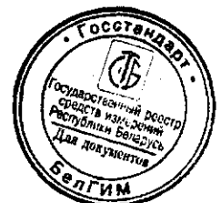
Схема пломбировки от несанкционированного доступа с указанием мест для нанесения отпечатков клейм и расположения наклеек приведена в приложении Б.

Фотография общего вида ИП приведена в приложении А.