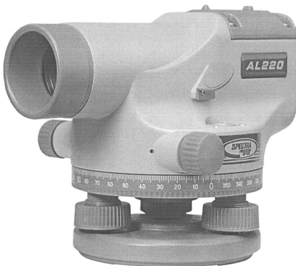
Рисунок 1.А Место нанесения знака поверки (клеймо-наклейка)