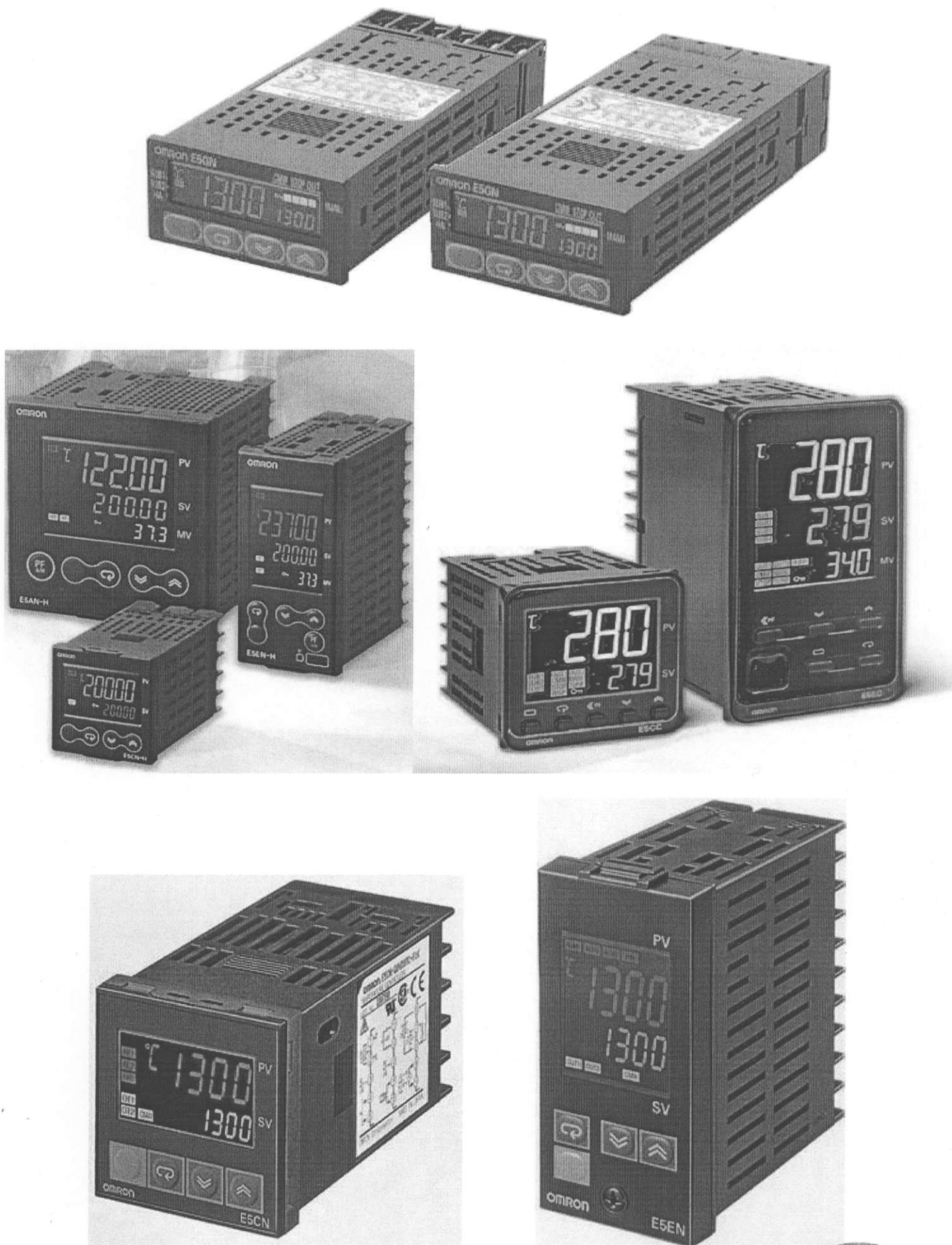
Рисунок 1 – Внешний вид приборов