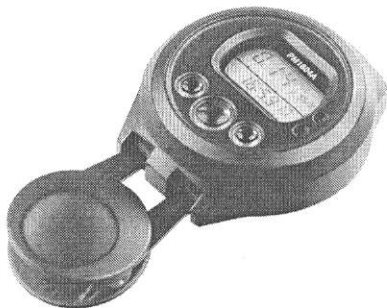
Рисунок 1 – Внешний вид прибора

Внешний вид прибора представлен на рисунке 1.