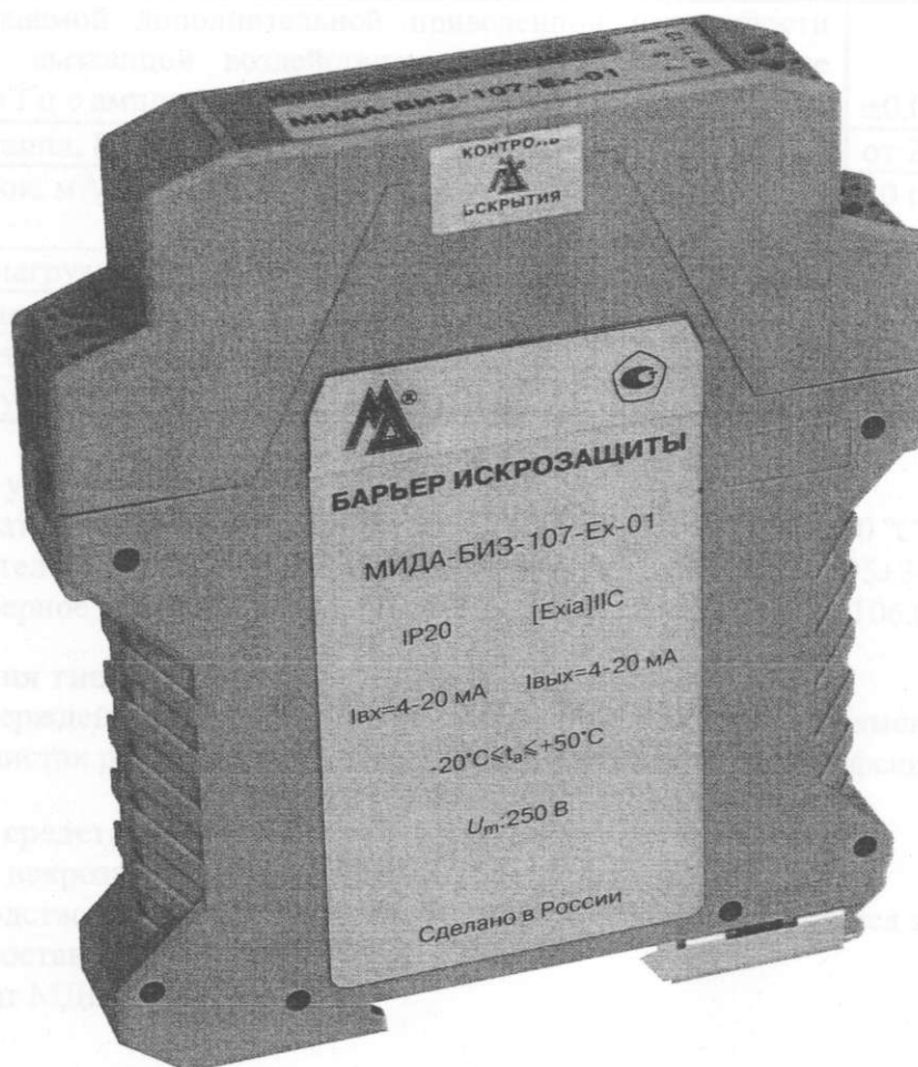
Рисунок 1 – Фотография общего вида

Контроль несанкционированного доступа внутрь блока обеспечивается разрушающимися при попытке вскрытия наклейками с товарным знаком изготовителя.