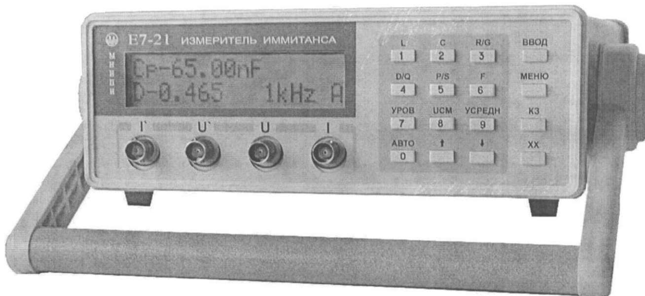
Рисунок 1 - Измеритель иммитанса E7-21. Внешний вид

Внешний вид прибора приведен на рисунке 1.