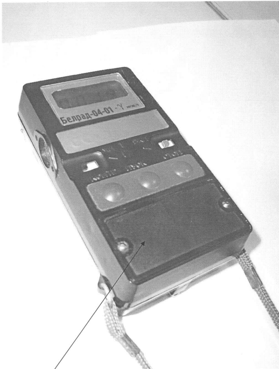
Схема с указанием места нанесения знака поверки (клейма-наклейки)

место нанесения знака поверки (клейма-наклейки)