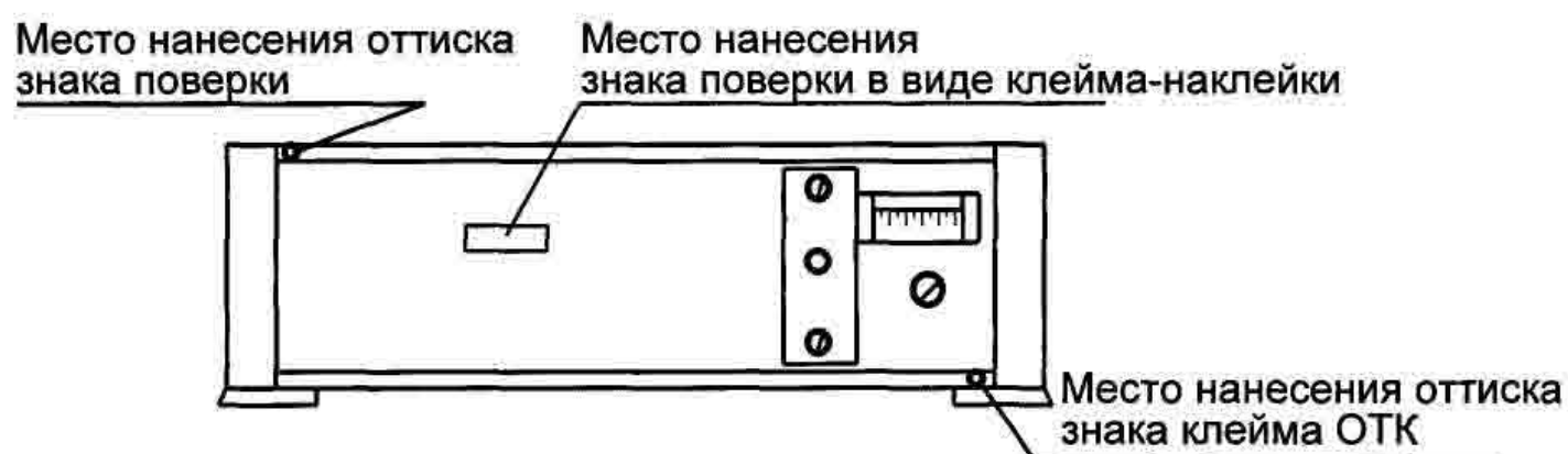
Рисунок А.1 – Место нанесения отиска знака поверки, отиска знака клейма ОТК, знака поверки в виде клейма-наклейки на задней панели вольтметров.