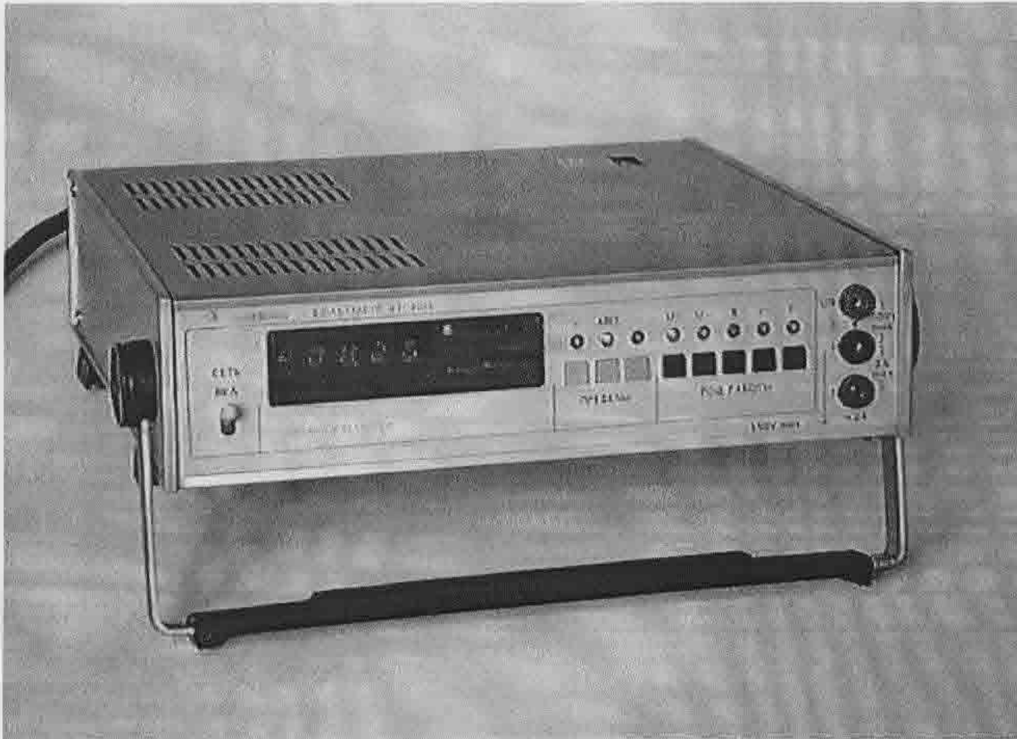
Рисунок 1 – Общий вид вольтметров