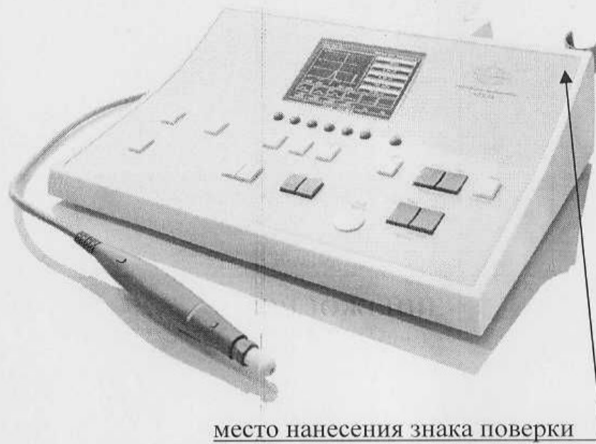
Схема с указанием места нанесения знака поверки в виде клейма-наклейки