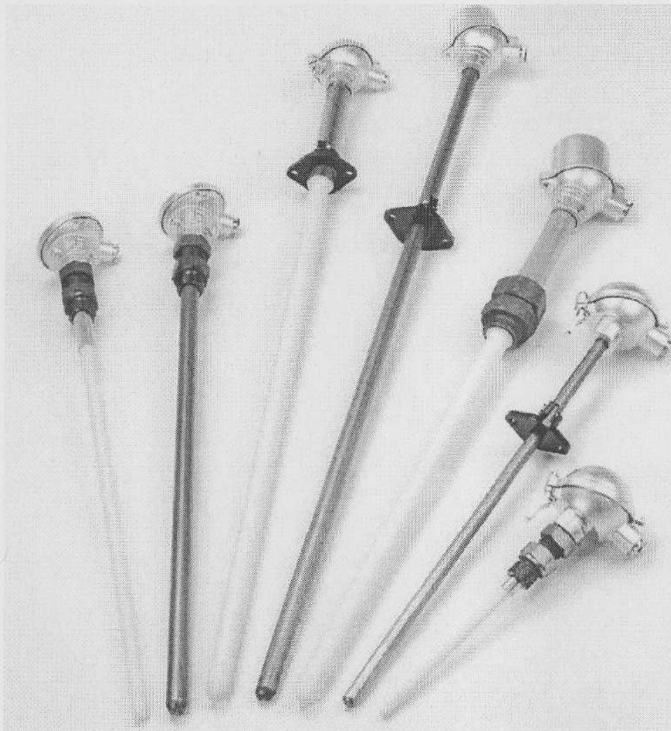
Рисунок 1 - Внешний вид термопар серии 1075, 1099

Внешний вид термопар приведен на рисунке 1.