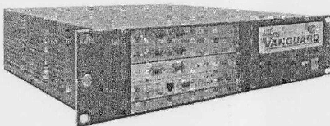
Рисунок 1 – Внешний вид системы Series 5