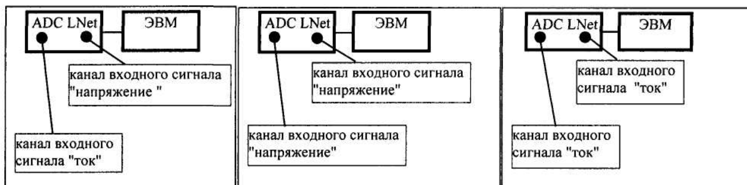
Рисунок 1 - Структурная схема системы "Юнихром 97" и варианты ее конфигурации

– интерфейс связи спектрометрического прибора с компьютером, блок ADC LNet, который принимает аналоговый сигнал от прибора, усиливает его, преобразует в цифровой код и отправляет в компьютер. Блок ADC LNet имеет два канала измерений, функционирующих независимо друг от друга, обеспечивающих одновременную регистрацию информации, поступающей от приборов. Блок ADC LNet может иметь три варианта конфигурации каналов (Рисунок 1): "ток" - "напряжение", "напряжение" - "напряжение", "ток" - "ток".