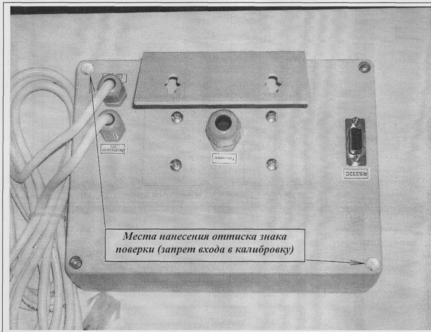
Схема пломбировки весов от несанкционированного доступа