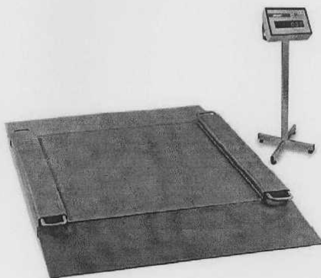
Рисунок 2 – Внешний вид весов с платформой с пандусами для наезда тележек с грузом