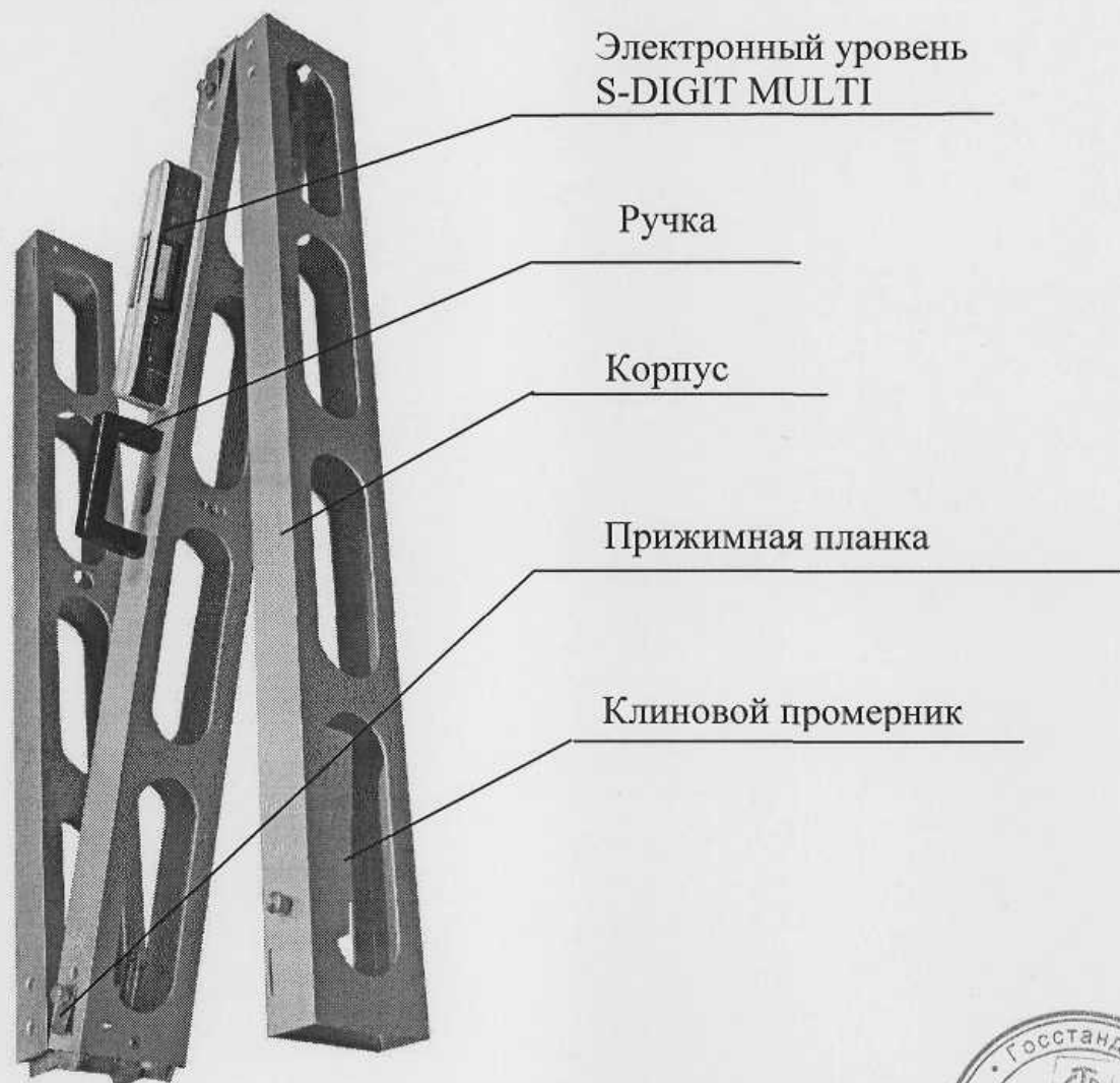
Рисунок 2 – Внешний вид рейки дорожной универсальной РДУ-АНДОР