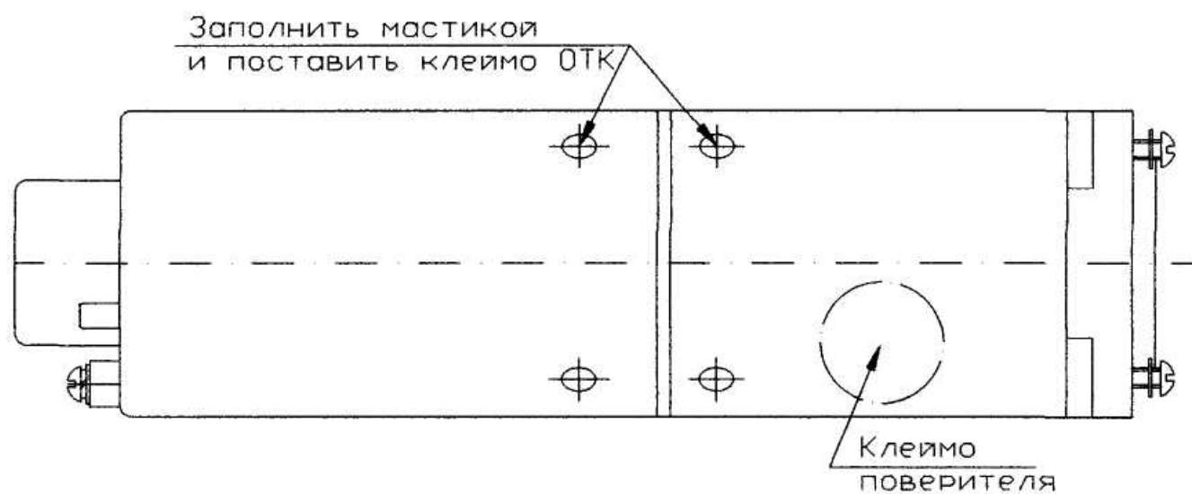
Рисунок 2 – Схема клеймения частотомеров ферродинамических ЧФ4 и ЧФ9