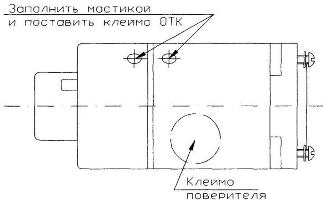
Рисунок 2 – Схема клеммения амперметра.