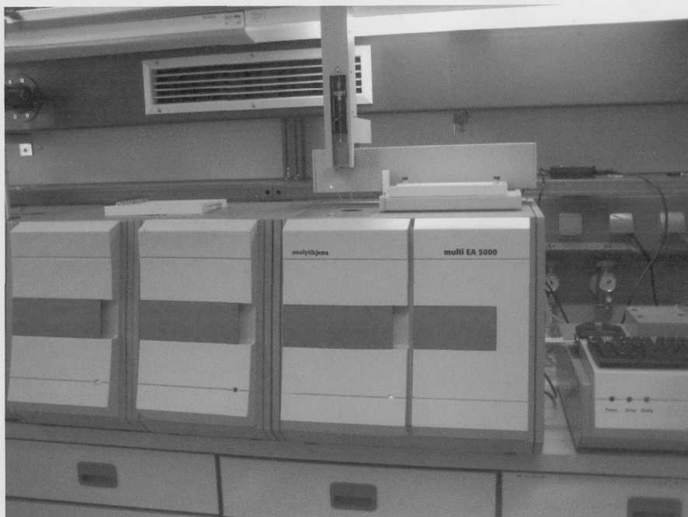
Рисунок 2. Общий вид анализатора EA 5000