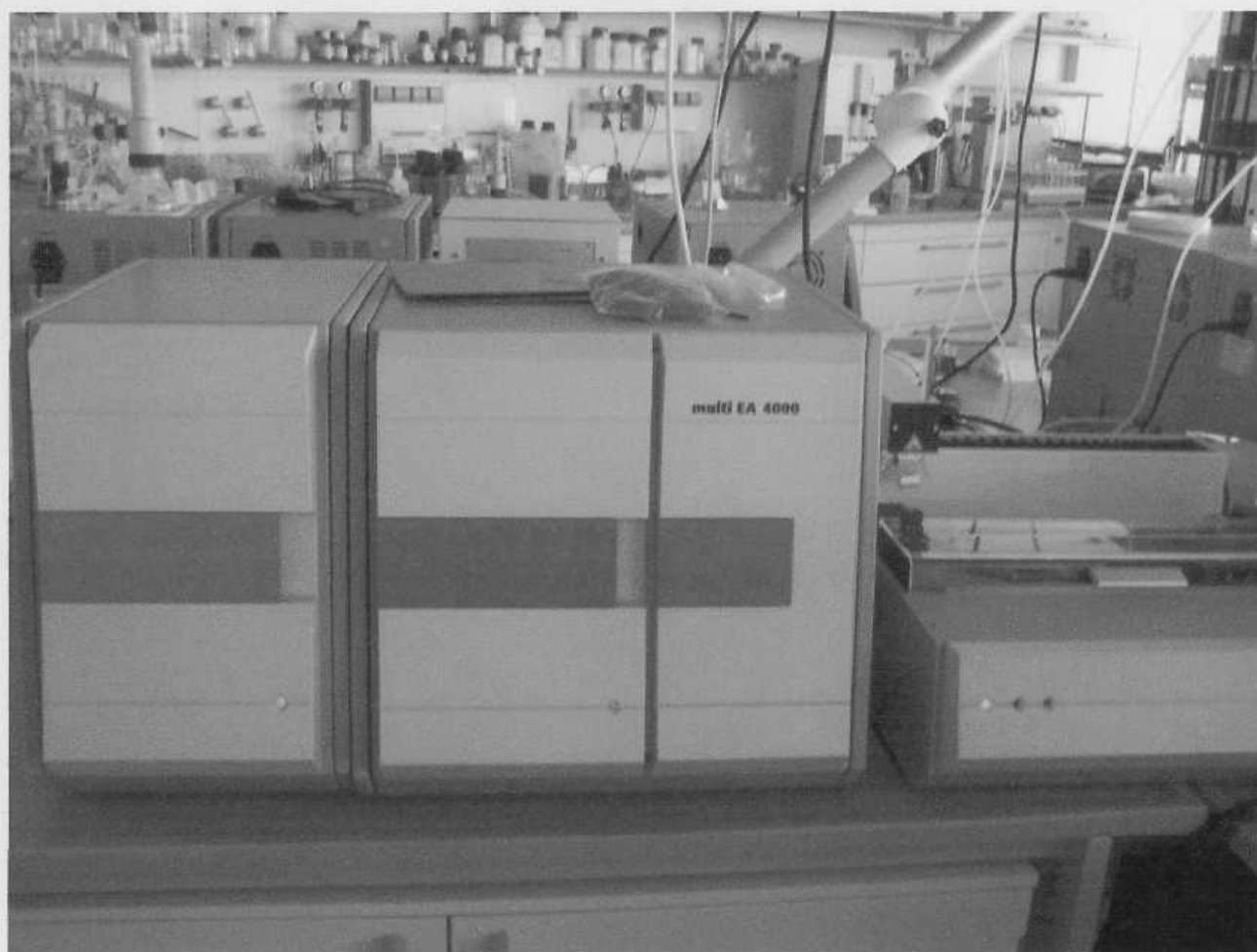
Рисунок 1. Общий вид анализатора EA 4000

На лицевую панель анализатора (детектора) наносится знак поверки (клеймо-наклейка).