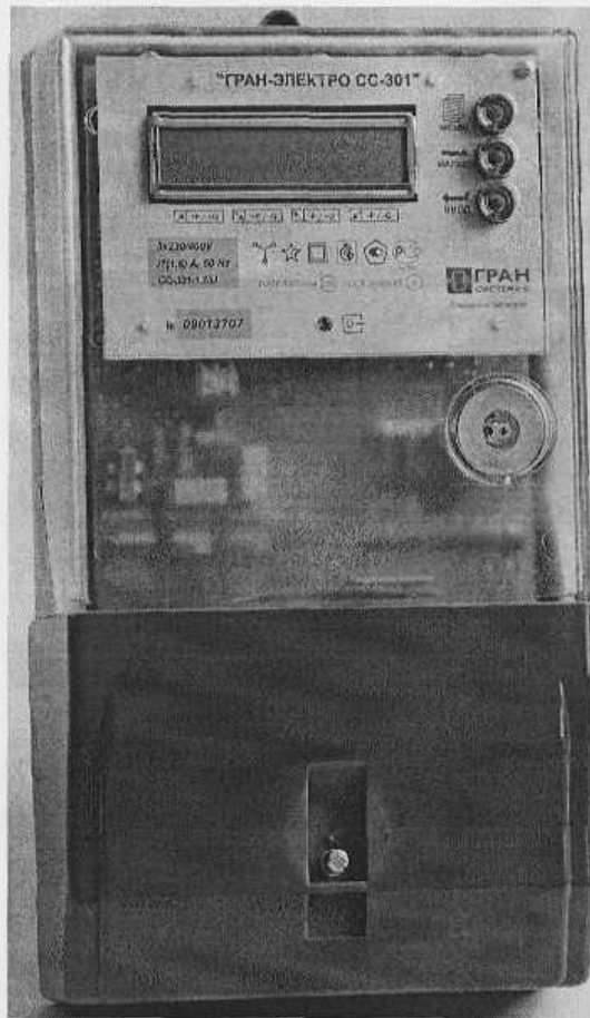
Рисунок 2.1 – Внешний вид счетчиков электрической энергии модификации "Гран-Электро СС-301-Х.Х Х Х Х"