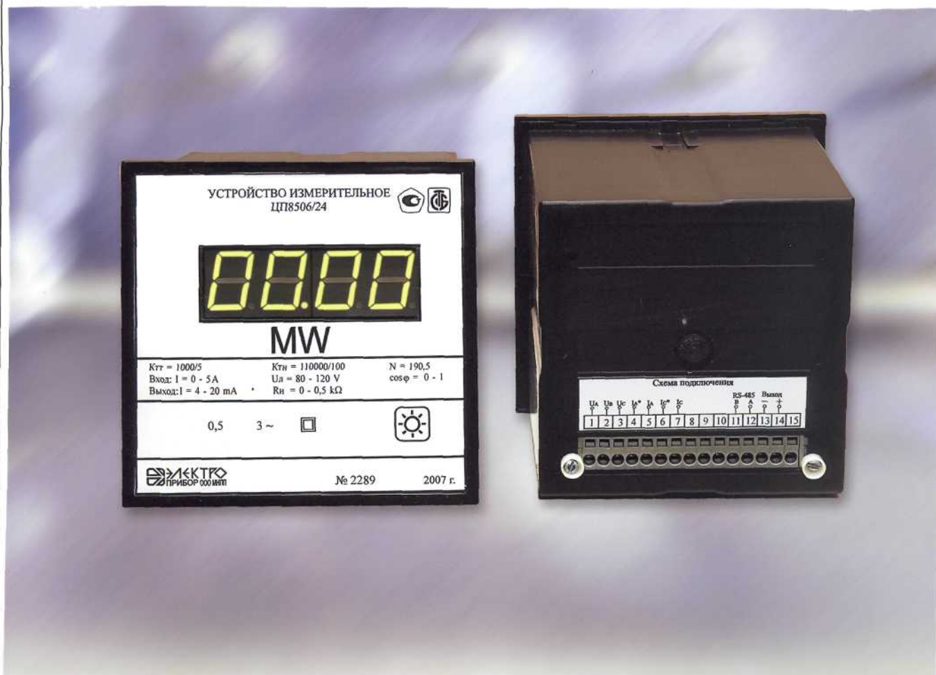
Рисунок 1 – Фотография общего вида ЦП8506/1 – ЦП8506/32