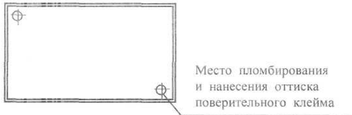
Схема пломбировки прибора