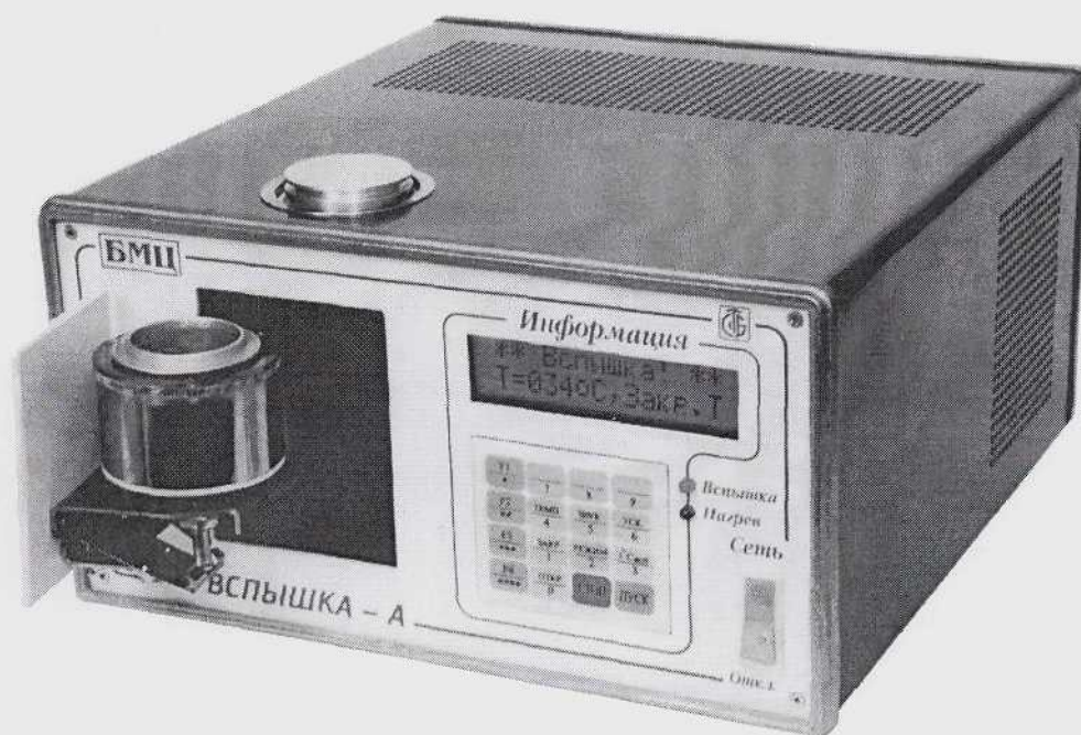
Рис. 1 Внешний вид регистратора автоматического температуры вспышки нефтепродуктов «Вспышка-А»

Схема с указанием места нанесения оттиска знака поверки приведена в приложении А.