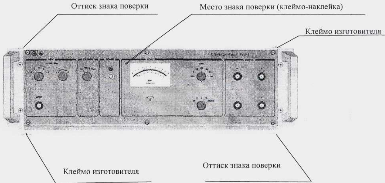
Рисунок А.1 – Вид измерителя спереди