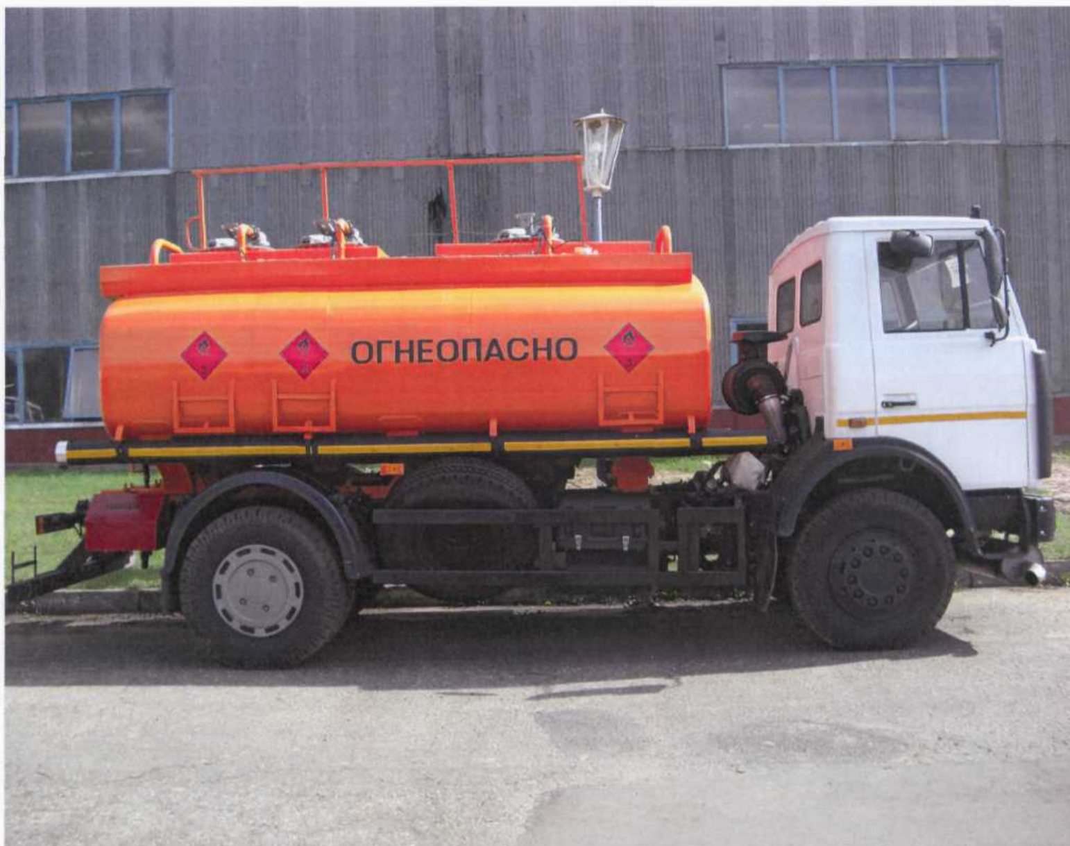
Рис.1. Внешний вид автоцистерны АЦ-10/3.

Фотография внешнего вида автоцистерны АЦ-10/3 приведена на рис. 1.