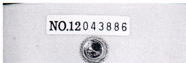
Рисунок 1.2 – Фотография маркировки измерителя уровня звука DT- 8852 № 12043886