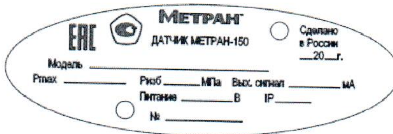
Рисунок 2 – Место нанесения знака утверждения типа и заводского номера