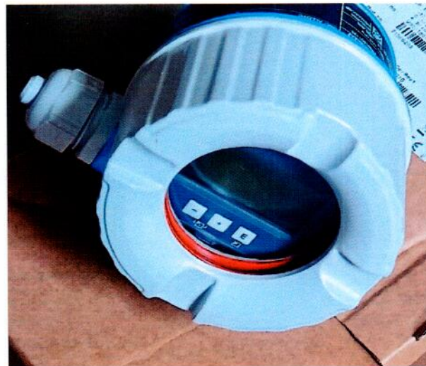
Рисунок 1.2 – Фотография общего вида встроенного цифрового дисплея преобразователя