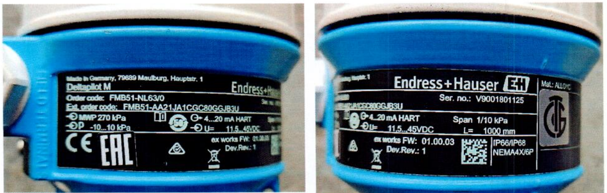
Рисунок 1.3 – Фотографии маркировки преобразователя