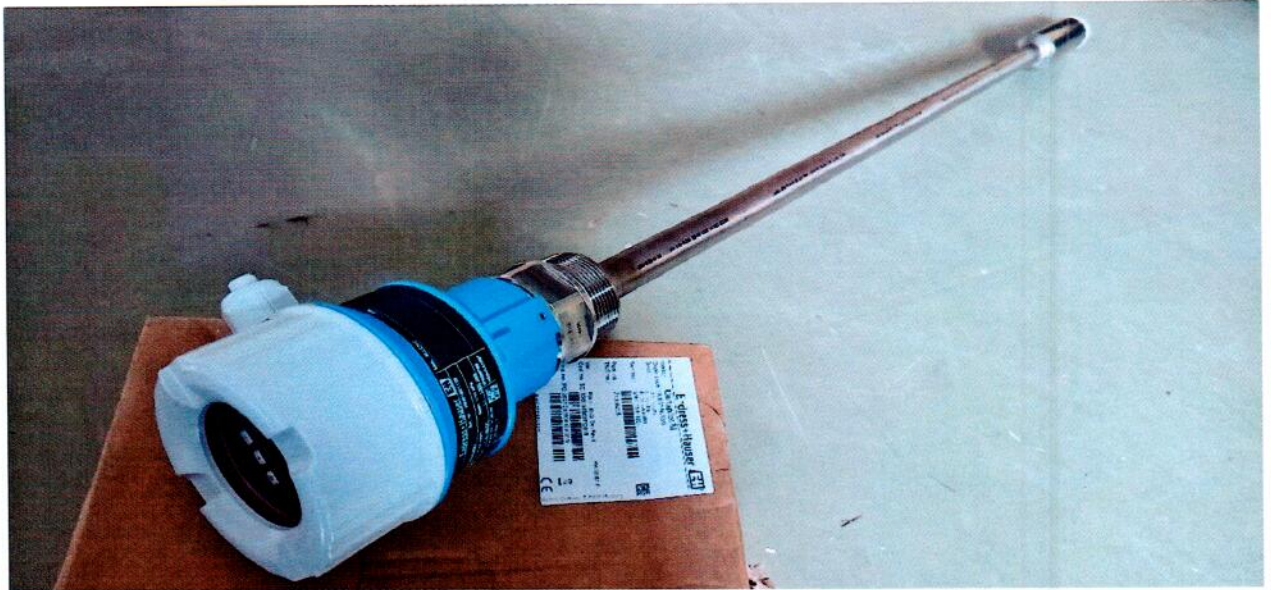
Рисунок 1.1 – Фотография общего вида преобразователя