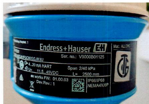
Рисунок 1.3 – Фотографии маркировки преобразователя