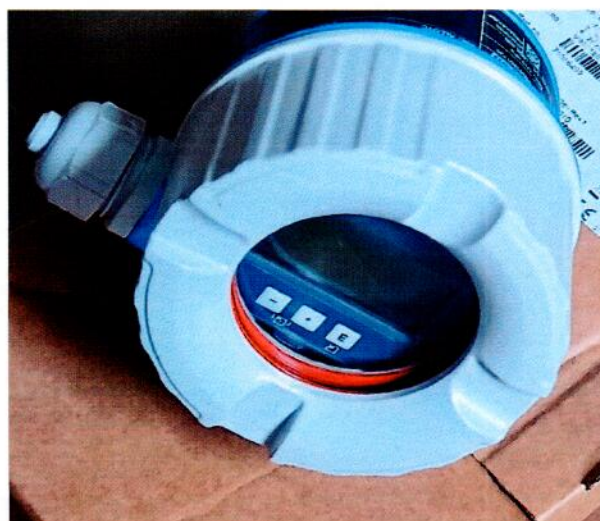
Рисунок 1.2 – Фотография общего вида встроенного цифрового дисплея преобразователя