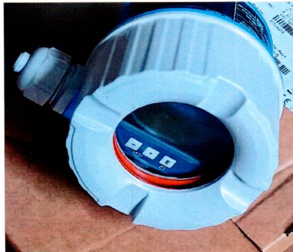
Рисунок 1.2 – Фотография общего вида встроенного цифрового дисплея преобразователя