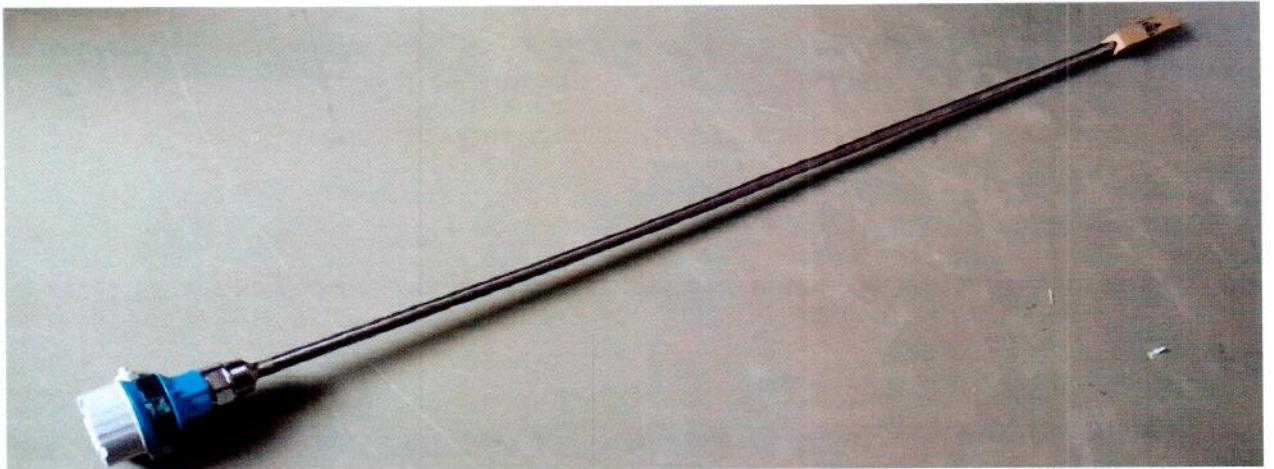
Рисунок 1.1 – Фотография общего вида преобразователя