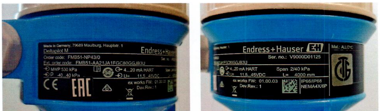
Рисунок 1.3 – Фотографии маркировки преобразователя