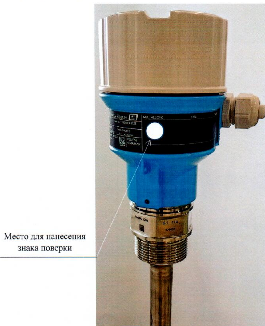
Рисунок 2.1 – Схема (рисунок) с указанием места для нанесения знака поверки средств измерений

Схема (рисунок) с указанием места для нанесения знака поверки средств измерений