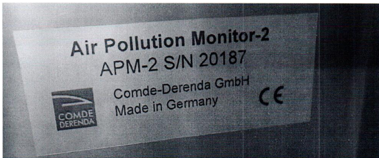
Рисунок 1.2 – Фотография маркировки анализатора пыли АРМ-2 № 20187