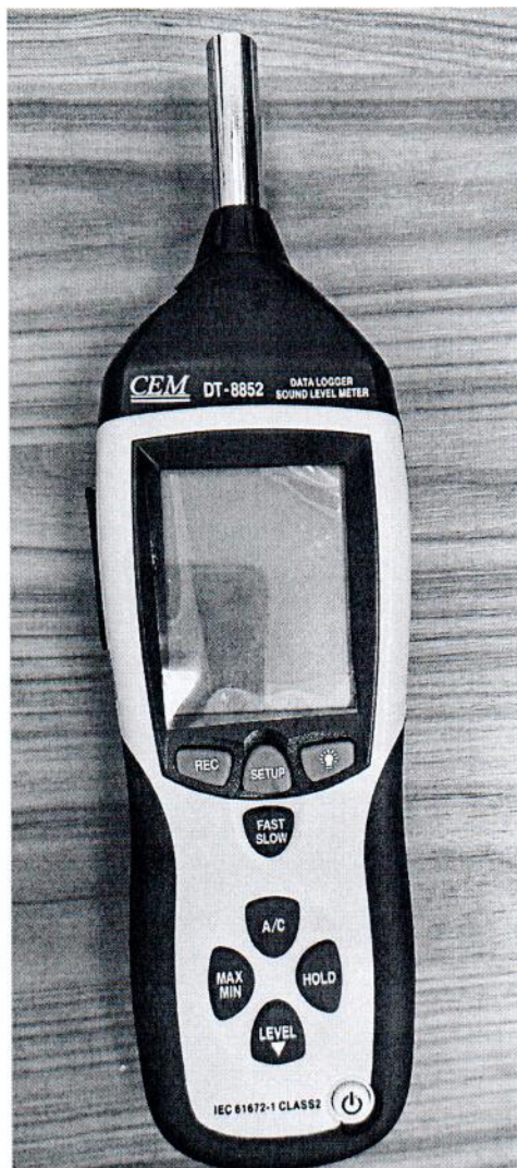
Рисунок 1.1 – Фотография общего вида измерителя уровня звука DT- 8852 № 12043861