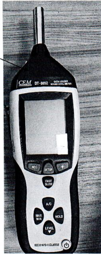
Рисунок 2.1 – Схема (рисунок) с указанием места для нанесения знака поверки