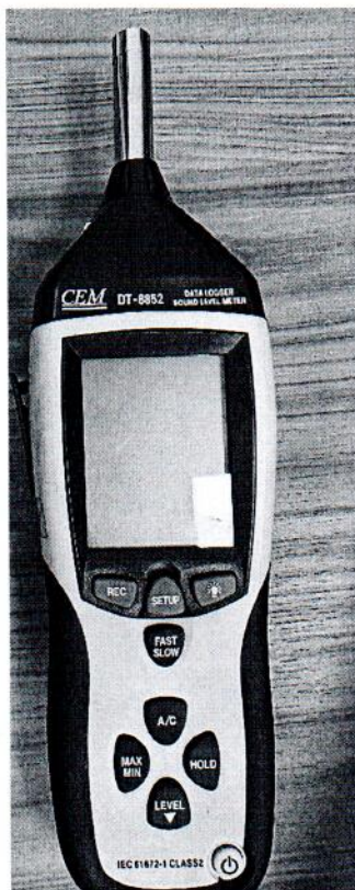
Рисунок 1.1 – Фотография общего вида измерителя уровня звука DT- 8852 № 12043892