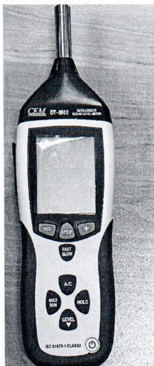
Рисунок 1.1 – Фотография общего вида измерителя уровня звука DT- 8852 № 230737288