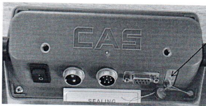
Рисунок 3.1 – Фотография с указанием места пломбировки от несанкционированного доступа в виде давления на пломбу на тыльной стороне индикатора весового CAS CI-2001A

Место пломбировки от несанкционированного доступа