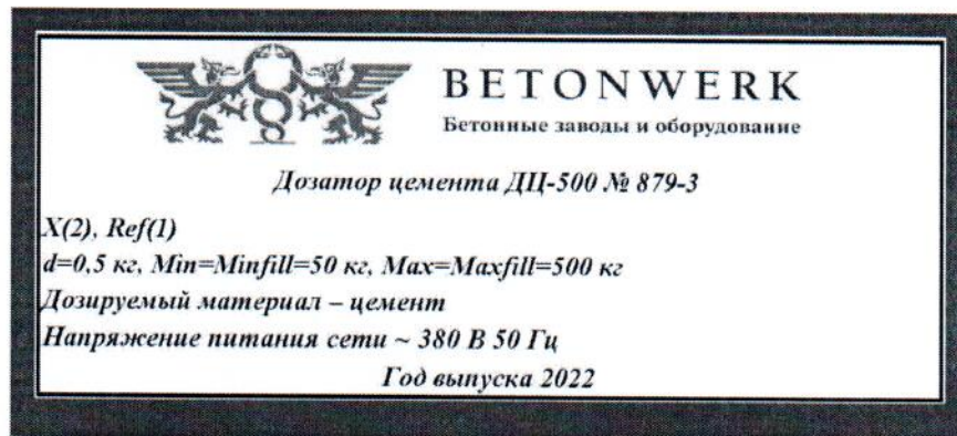
Рисунок 1.2 – Маркировка дозатора цемента ДЦ-500 № 879-3