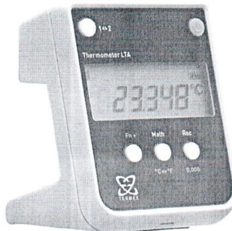
Рисунок 3 – Внешний вид электронного блока термометра, имеющего второй канал измерений температуры или встроенный секундомер

Пломбирование термометров осуществляется путем наклеивания на заднюю сторону электронного блока пломбировочной наклейки с маркировкой.