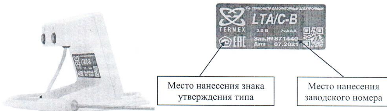
Рисунок 2 – Внешний вид термометра с неразъемным соединением датчика к электронному блоку и его пломбировочная наклейка с указанием мест нанесения знака утверждения типа и заводского номера